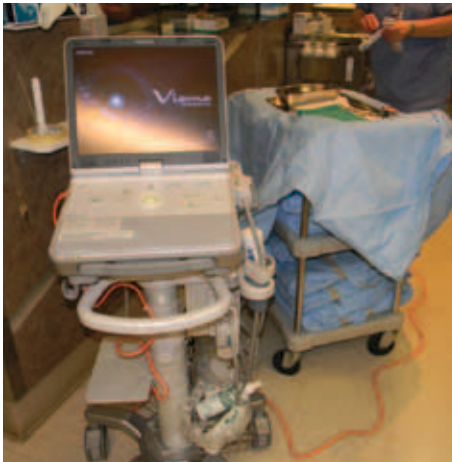
PLATE-FORME DE BIOPSIE POUR LE CANCER DU SEIN (70 000 $)

L'échographe et l'aiguille de biopsie permettent la prise d'échantillons de tissus ciblés par des techniques de localisation précises en résonance magnétique, mammographie digitale stéréotaxique et en échographie. Ces équipements de pointe viennent s'ajouter à la gamme de services offerts en imagerie du sein et donnent maintenant accès à une nouvelle procédure évitant aux patients de se déplacer en Ontario, par exemple. Le patient bénéficie ainsi d'un diagnostic précoce, engendrant un traitement plus rapide ce qui augmente ses chances de survie. Ces appareils permettent également d'optimiser l'utilisation des salles d'intervention et d'augmenter l'accessibilité à ce type de biopsie de plus en plus nécessaire à un diagnostic précoce du cancer.